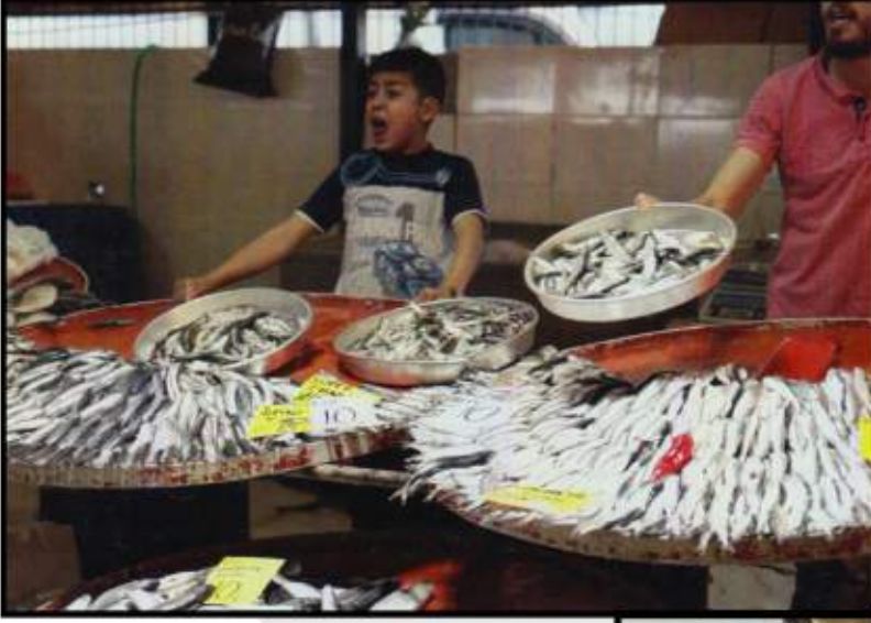
Yemek, Şanlı Yemek Daniel Lang Film Çalıştayı

Yemek hepimiz için duygular ve anılar yaratır! Hepimizin en sevdiğimiz ya da tahammül edemediğimiz yiyecekler olmak üzere belirli yiyeceklerle eşsiz ilişkileri vardır. Bu düşünce ile, öğrencilerden kendi deneyimlerinden yola çıkarak, yiyecek öykülerini kısa filme yansıtılmaları istenmiştir.